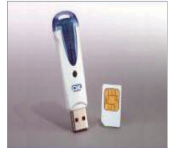
× شكل التوقيع الإلكتروني المستخدم في مصر المسمى بـ (Token)